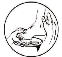
Die Fußwaschung (Joh 13) – das Logo der Gemeinschaft